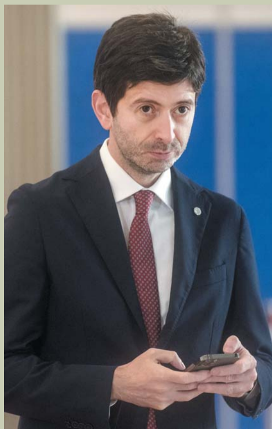
Roberto Speranza è il ras del Pd in Basilicata