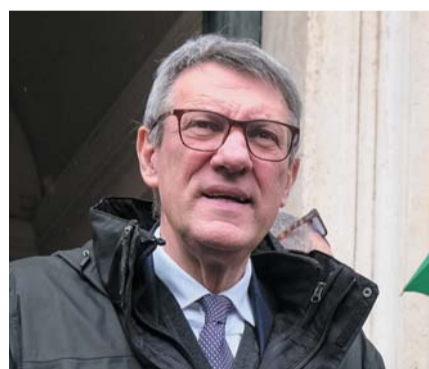
Maurizio Landini, leader della Cgil

■ Sarà che, per quella data, ci troveremo in piena primavera. Sarà che le elezioni europee, per allora, ci attenderanno davvero dietro l'angolo. Comunque Maurizio Landini, segretario della Cgil, riprende il megafono e torna in piazza a Roma, sabato 20 aprile. Assieme al sindacato di Corso Italia, la Uil, nello schema che ha caratterizzato la recente mobilitazione congiunta pre-natalizia, da cui il fronte della triplice esce spaccato, con la Cisl a mantenere una posizione dialogante con il governo. Cgil e Uil hanno redatto una nota comune in cui si spiegano le ragioni dell'iniziativa: «Per il diritto alla salute, a partire dalla difesa e dal rilancio del servizio sanitario nazionale pubblico, dal finanziamento delle leggi sulla non autosufficienza, e dalla salute e sicurezza sui luoghi di lavoro. Infine, per una vera riforma fiscale e un aumento reale dei salari». Inoltre, prima di allora ci sarà un'altra mobilitazione congiunta, il 22 marzo, alla Leopolda dove, scrivono ancora Maurizio Landini e Pierpaolo Bombardieri, «abbiamo convocato l'assemblea di 1500 delegati e rappresentanti per la sicurezza. L'appuntamento del 22 sarà