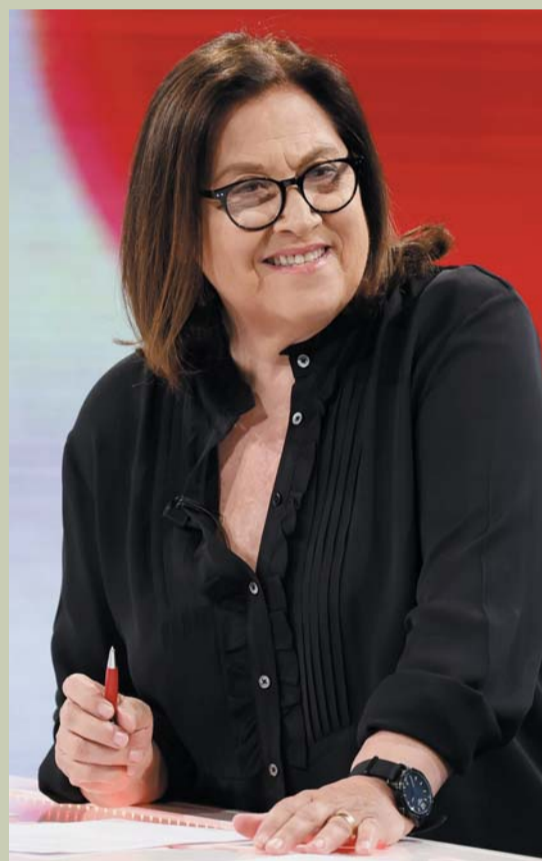
Lucia Annunziata ha lasciato la Rai in polemica con Fdi